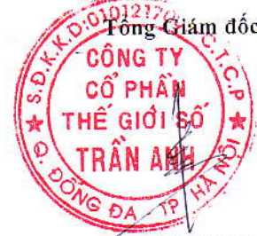
TRẦN XUÂN KIÊN